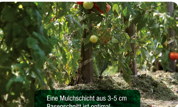
Eine Mulchschicht aus 3-5 cm Rasenschnitt ist optimal.

Als Mulchmaterial eignet sich im Prinzip jedes organische Material, das im Garten anfällt: Laub, Rasenschnitt, ausgejätete Beikräuter, Stroh und Holzhäcksel. Aber auch anorganische Materialien wie z.B. Kies können eingesetzt werden. Die Mulchschichten sollten maximal 3-5 cm stark sein, damit keine Fäulnis entsteht. Denn vor allem Rasenschnitt kann - frisch verwendet - noch recht feucht sein. Je feuchter das Mulchmaterial und je dicker die Schicht, in der es aufgetragen wird, desto leichter kann es zur Fäulnis kommen. Daher sollte möglichst antrocknetes Material verwendet werden. Bei holzigem Material wie Holzhäcksel kann im Boden Stickstoff fixiert werden, hier zum Ausgleich ungefähr einen Esslöffel Hornspäne/m 2 untermischen (siehe Tabelle auf Seite 4).